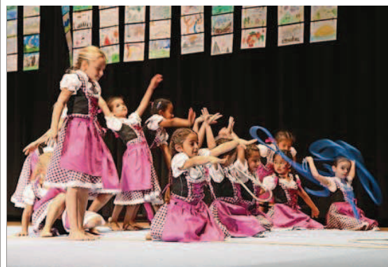
... und die kleinen Geräteturnerinnen aus Kloten im Trachtenrock.