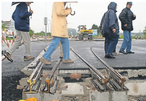
Die ältesten Gleise der Glattalbahn – hier bei einer Begehung der Baustelle an der Thurgauerstrasse – sind gut 10 Jahre alt.

Bei einem Anlagewert von rund 260 Millionen Franken wenden die VBG (über einen Zeitraum von etwa 10 Jahren) rund 1 bis 1,5 Millionen Franken jährlich für den Unterhalt der Infrastruktur auf.