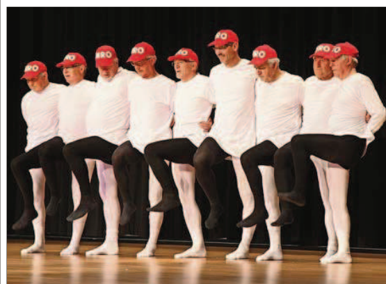
Die Männerriege präsentierte sich agil und in Strumpfhosen ...

Inzwischen ist auch «Wanderful» bereits Geschichte. Das Publikum war begeistert, die Darbietungen hochkarätig und auch die musikalische Begleitung und die Kostüme wurde gelobt. Die Zuschauerinnen und Zuschauer erlebten hautnah, wie attraktiv das Turnen sein kann. Sämtlichen Mitwirkenden gebührt ein Kompliment für die Ausdauer und die Disziplin, mit der sie die einzelnen Nummern einstudiert hatten. Die akrobatischen Höhepunkte und die farbigen «Turnbilder» auf der Bühne des Schlufigwegsaals werden nicht so schnell in Vergessenheit geraten.