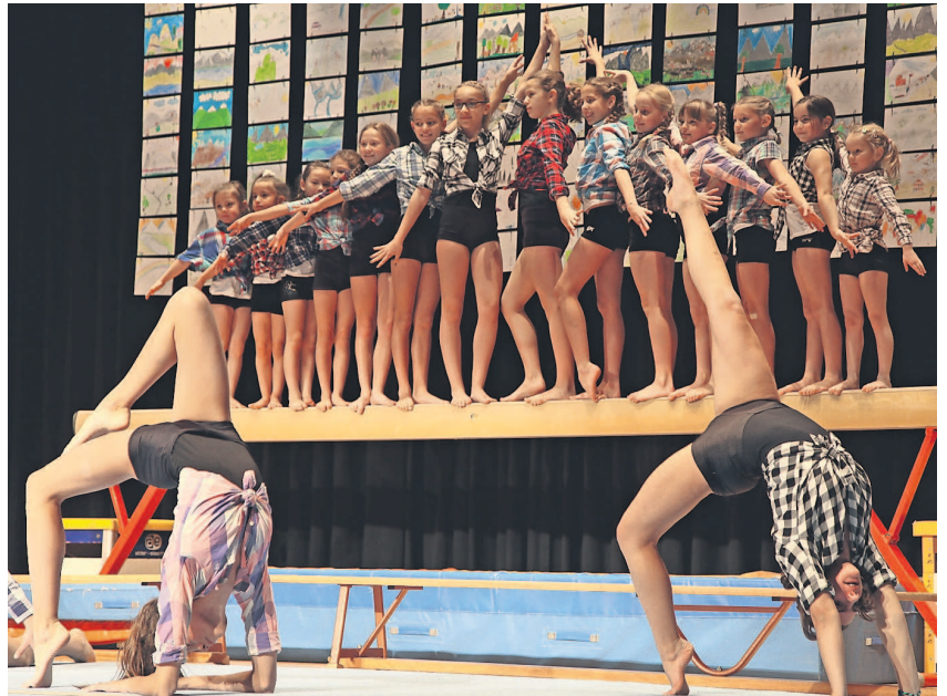
Turnen boomt nicht erst seit der Europameisterschaft in Bern – die Klopffiker beweisen es.